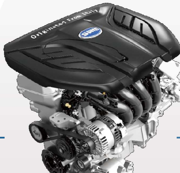
Двигатель S-power 1.5T Gold Power

Улучшенное распыление Повышение эффективности сгорания