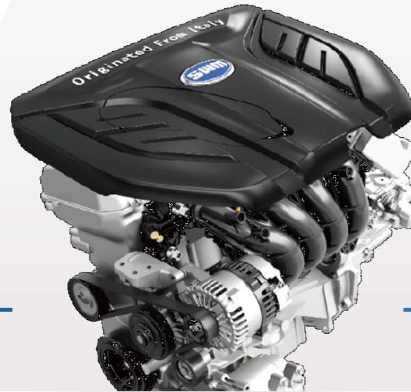
Двигатель S-power 1.5T Gold Power

Улучшенное распыление Повышение эффективности сгорания